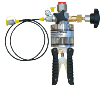
Handprüfpumpe Typ CPP700-H